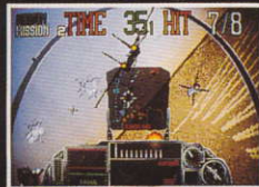
Screen shot from Coin-Up version